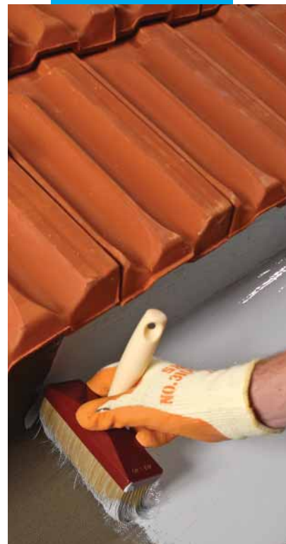
Particolare di gronda impermeabilizzata con Mapelastic Smart e rivestita con Elastocolor Waterproof

Importante: nel caso di verniciatura di vasche di contenimento acqua o piscine, indipendentemente dal numero di mani applicate, è necessario garantire un consumo di almeno 0,8 kg/m 2 di Elastocolor Waterproof al fine di assicurare uno spessore di prodotto adeguato a garantire una protezione duratura del manufatto.