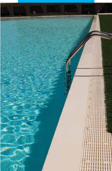
Particolare di piscina realizzata con Elastocolor Waterproof