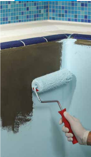
Applicazione a rullo di Elastocolor Waterproof

A distanza di almeno 15 giorni dall'applicazione di Mapelastic o Mapelastic Smart applicare Elastocolor Waterproof in almeno 2 mani.